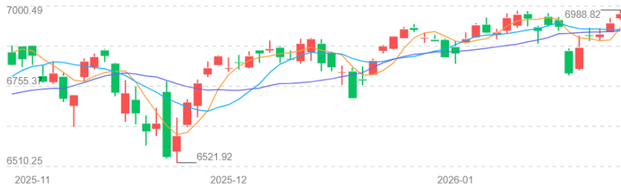
图1 2026年1月下半月标准普尔500指数

2026年1月下半月，美国市场呈现出先抑后扬的震荡走势，最终推动标普500指数于1月28日收报6,978.60点，创下历史收盘新高。下半月开局，市场延续了上半月在7000点整数关口前的震荡整理，指数于1月16日收于6,940.01点，并在1月20日一度大幅下挫至6,796.86点，部分原因是地缘政治紧张局势对市场情绪造成冲击。然而，随后公布的一系列积极宏观经济数据为市场提供了关键支撑：1月制造业PMI初值小幅改善至51.9，服务业PMI则持稳于52.5；同时，更早发布的2025年11月核心PCE物价指数同比增长2.8%，月度环比仅增0.2%，而2025年12月CPI环比增长0.3%，同比增长2.7%，这些数据共同强化了通胀受控、经济具备韧性的“软着陆”叙事，抵消了增长担忧。受上述因素推动，市场风险偏好回升，标普500指数自1月21日起连续反弹，以苹果、微软为首的科技权重股强势上涨，足以引领标普500指数突破历史高位。总体而言，1月下半月市场成功消化了波动并创下新高，其核心逻辑在于向好的经济数据与企业盈利，暂时压过了地缘政治噪音带来的扰动，为第一季度奠定了谨慎乐观的基调。