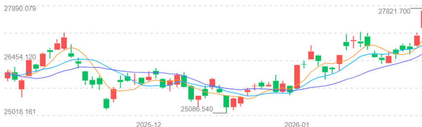
图2 2026年1月下半月恒生指数

2026年1月下半月，香港恒生指数在触及上半月高位后，进入了一个震荡整理的阶段，市场整体呈现先抑后扬的格局。下半月伊始，市场从高位回调，恒生指数从1月16日的收盘价26,844.96点开始下行调整，并在1月23日收于26,749.51点。市场情绪一度偏向谨慎，根据香港交易所的期货数据，在1月16日的交易中，恒指期货合约的全日波动区间下探至25,180点。板块表现显著分化，在1月16日，地产分类指数和公用事业分类指数成为少数收涨的板块，而金融与工商业分类指数则随大市下跌。临近1月末，市场情绪在1月28日明显回暖，当日恒生指数午间休盘时大涨2.21%，恒生科技指数亦上涨1.74%。盘面上，石油石化、消费及电信服务板块领涨，其中中港石油涨幅超过34%。南向资金在当日上午也呈现净买入状态。此外，前一夜（1月27日）的夜期交易已预示了市场的强势，恒生指数主连夜盘收涨0.43%。